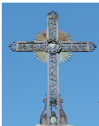
St Bertrand de Comminges