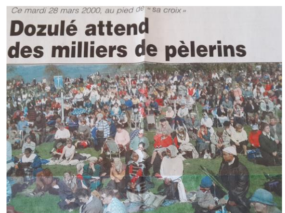
Ce mardi 28 mars 2000, au pied de « sa croix » Dozulé attend des milliers de pèlerins Pays d'Auge – 28 mars 2000 au pied de la Croix : Depuis 1983, le rassemblement du « 28 mars » a vite grossi pour prendre l'ampleur qu'on lui connaît aujourd'hui.